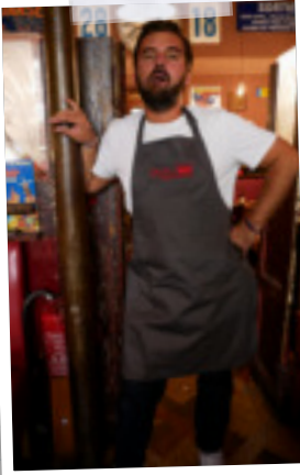
Le tablier du Chef 18€