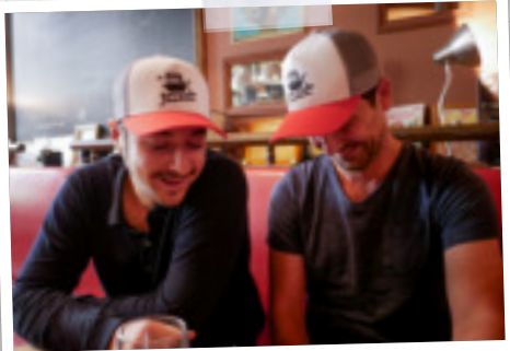
La casquette des Fils 10€