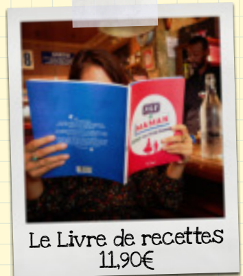
Le Livre de recettes 11,90€