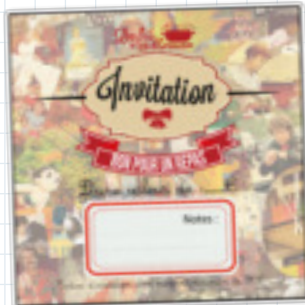
Le bon cadeau