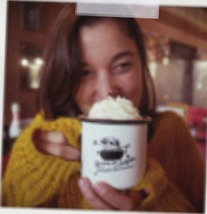
LE MUG 9€