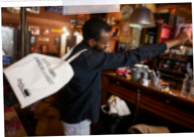
Le sac (ou cape) en toile 4€