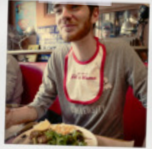
Le bavoir 10€