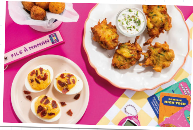
Planche géniale des Fils à partager 25€

Croquettes de Babybel®, beignets de courgettes au Parmesan, bâtonnets de poulet aux corn flakes, croquettes de chorizo, cornet de frites, sauce des Fistons, fromage frais aux herbes