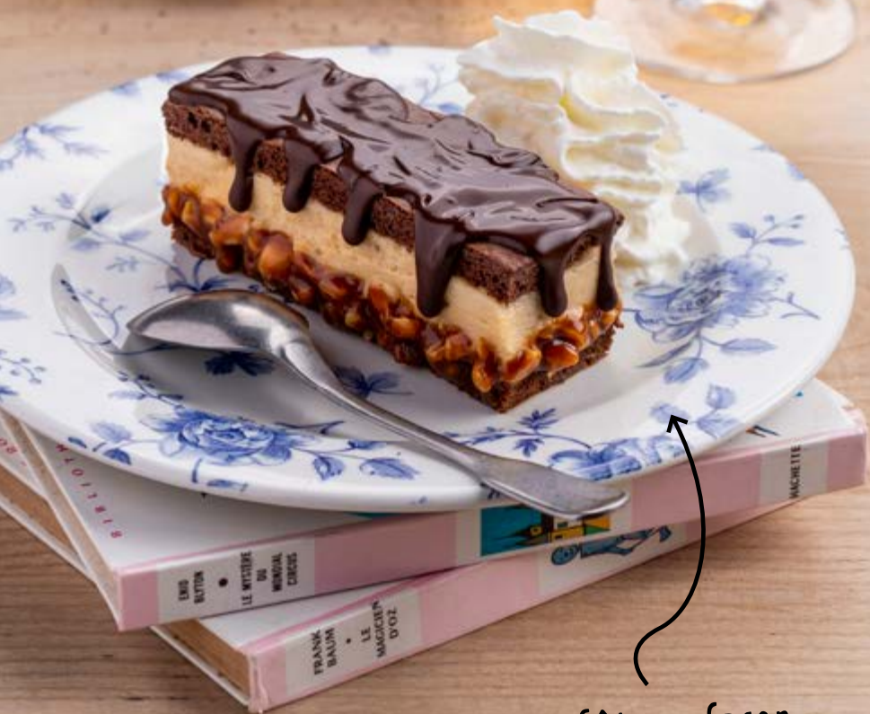
Gâteau façon Snickers