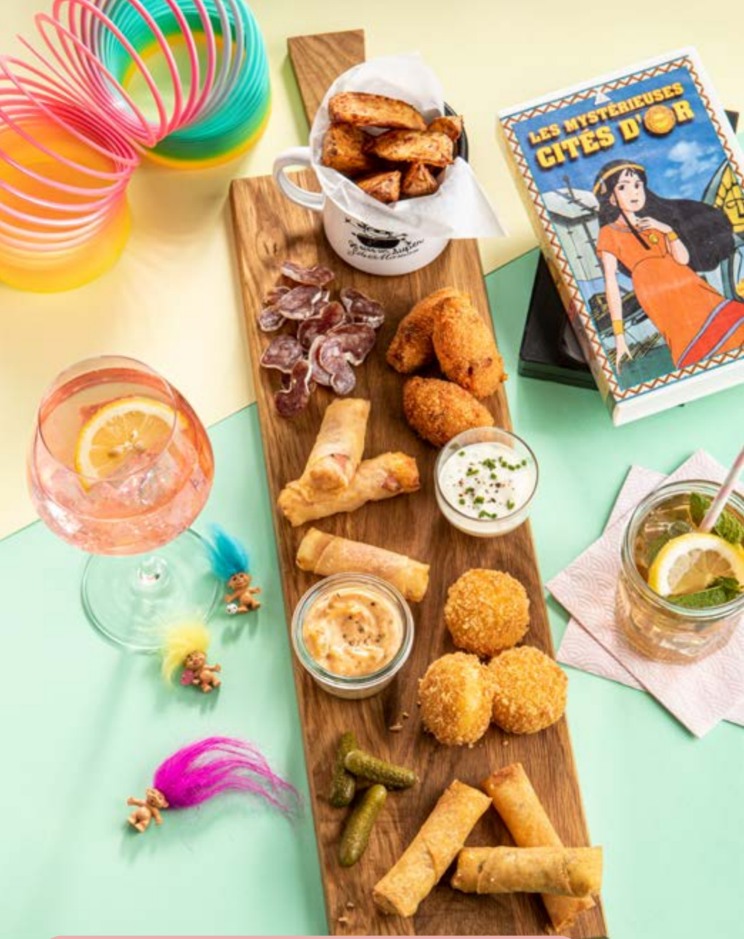
Planche géniale des Fils 25€

Croquettes de Babybel ® , croquettes de chorizo, croustillants jambon à la truffe, croustillants à la Fourme d'Ambert, saucisse sèche, potatoes maison au paprika