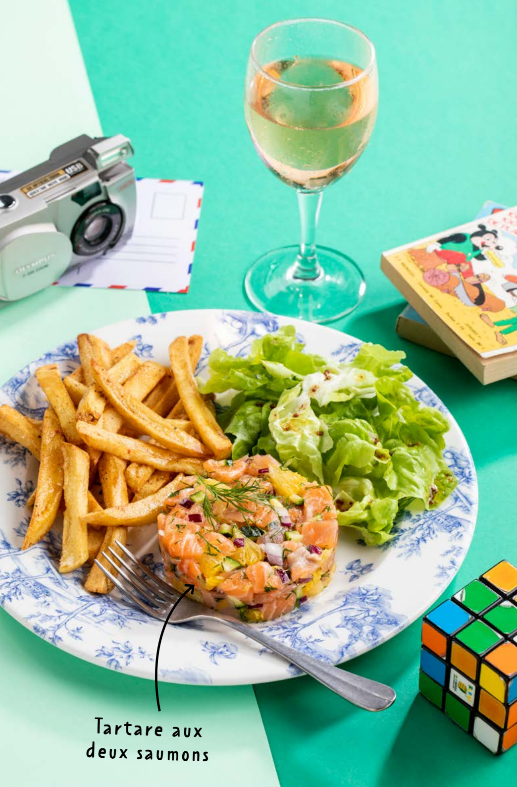
Tartare aux deux saumons