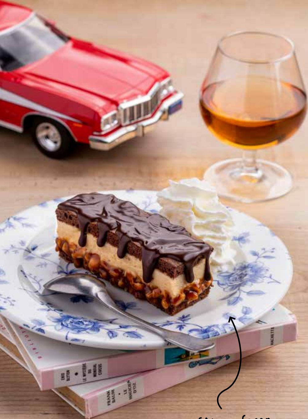
Gâteau façon Snickers